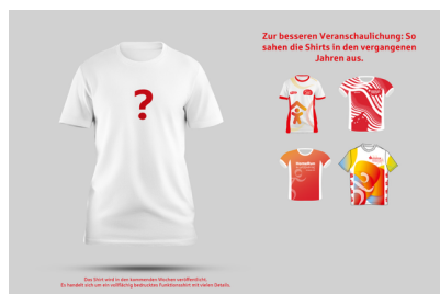
Größentabelle Sparkassen-Küstenmarathon Funktionsshirts vollflächigem Druck

Das offizielle Veranstaltungsshirt 2026 mit aufwendigen Front- und Rückendruck zum Preis von 39,90 €. Bestellschluss: 10. August 2026. Das Design werden wir in den kommenden Wochen bekanntgeben. Eine Größentabelle und nähere Beschreibungen zum Shirt findest Du hier.