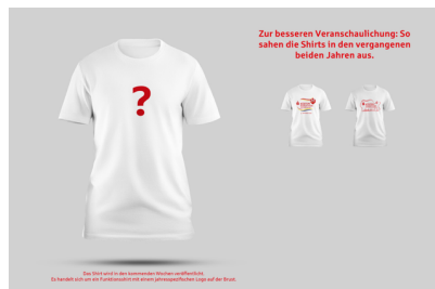
Größentabelle Sparkassen-Küstenmarathon Funktionsshirts Brustdruck

Das offizielle Veranstaltungsshirt mit Brustdruck als Funktionsshirt zum Preis von 15,00 €, Bestellschluss: 10.08.2026